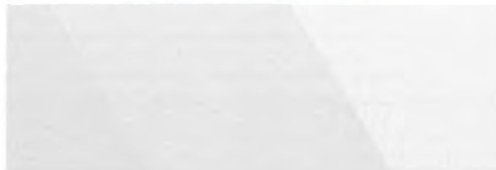
Tabel 45 - Incidente, plângeri și probleme privind drepturile omului și SSM