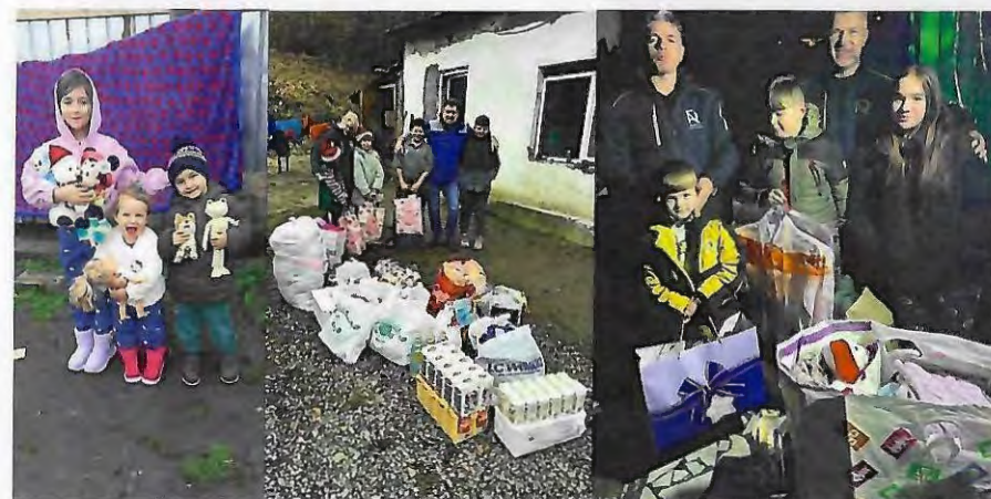
Fig. 4 – Imagini de la Compania 2025 de donare a produselor pentru persoane aflate în dificultate materială

De asemenea, la nivelul R.A.R. există elaborat un regulament de acordare a sponsorizărilor. Sponsorizări și donații efectuate de către R.A.R. în anul 2025 au totalizat 100.000 RON.