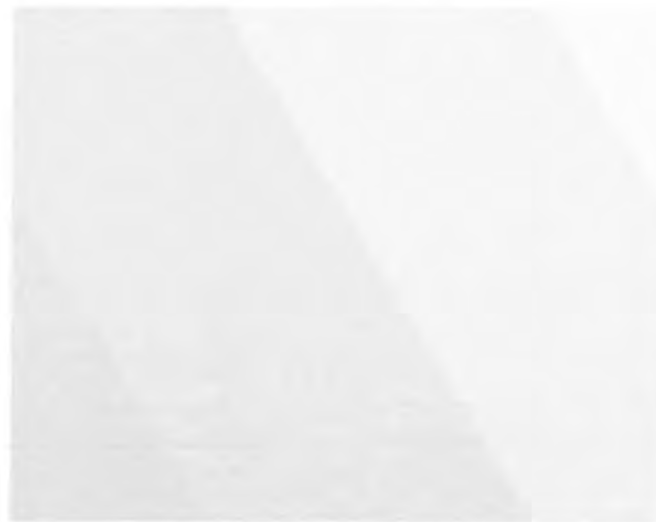
Fig. 2 – Obiective de Dezvoltare Durabilă ONU la care R.A.R. contribuie

Luarea unor măsuri urgente de combatere a schimbărilor climatice și a impactului lor