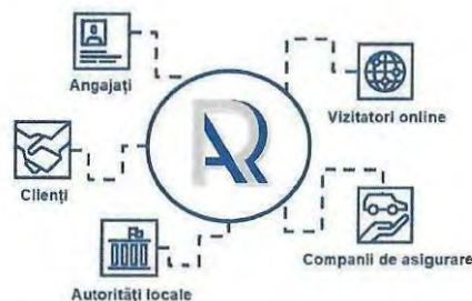
Fig. 3 – Harta părților interesate

RAR implementează o abordare sistematică pentru consultarea stakeholderilor externi, desfășurând această activitate anual în cazul apariției unor noi categorii de părți interesate sau subiecte noi, respectiv la un interval de trei ani pentru stakeholderii existenți, în conformitate cu procedura internă adoptată. Pentru raportarea de sustenabilitate aferentă anului 2025, nu au fost identificate grupe noi de stakeholderi sau subiecte relevante noi, iar consultarea externă va fi efectuată pentru anul de raportare 2026, în anul 2027.