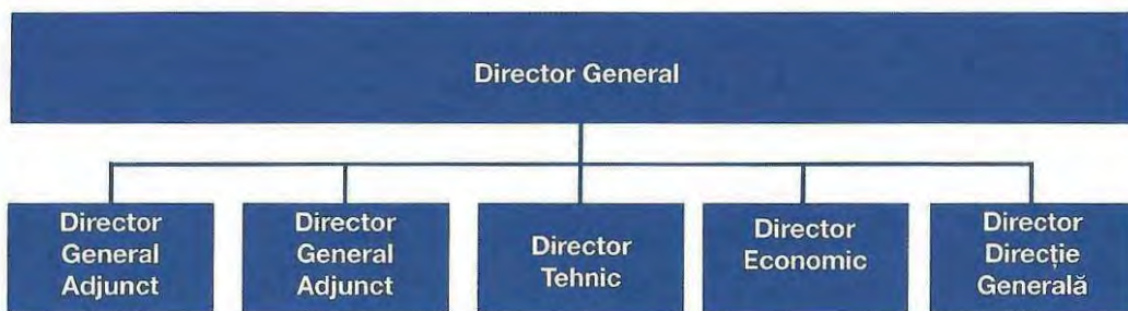
Fig 1 – Directoratul R.A.R.

Directorul General este persoana responsabilă, la nivel global, de conducerea și administrarea companiei. Acesta lucrează împreună cu cinci directori executivi: doi directori adjuncți, un director tehnic, un director economic și un director de direcție generală, conform prezentării de mai jos: